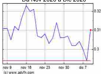
Grafico Azioni Wm Capital (BIT:WMC) Storico