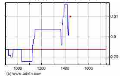
Grafico Azioni Wm Capital (BIT:WMC) Intraday Mercoledì 9 Dicembre 2020