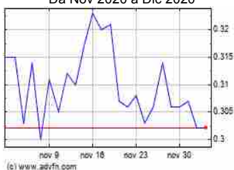
Grafico Azioni Wm Capital (BIT:WMC) Storico Da Nov 2020 a Dic 2020